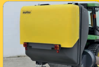
K nižší hlučnosti přispívá tvarově stálý plastový koš.

Large caster wheels, directionally stable in curves and on the road