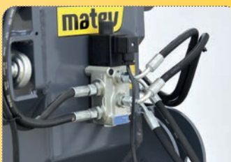
Díky elektromagnetickému ventilu si vystačíte pouze s jedním vnějším hydraulickým okruhem.

Optional flow control with fill level indicator