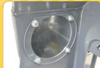
Ke kontrole a čištění ústrojí otevírá přístup volitelný průhledný kryt.

Extreme suction performance thanks to powerful low-wear turbine