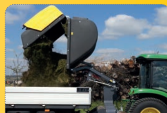
Vysoký zdvih a optimální přesah pro vysypání

Use with just one hydraulic control circuit due to electric changeover valve