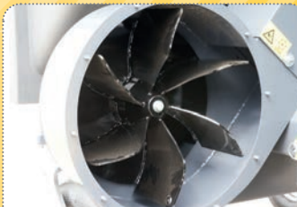
Odolná a výkonná turbína se vyznačuje mimořádným sacím účinkem.

Jednotlivé stroje jsou k dispozici ve verzích s výškovým zdvihem i bez něj a v barvách odpovídajících různým značkám traktorů. Volitelně jsou dostupné v neseném i závěsném provedení. Hydraulický okruh modelu s výškovým zdvihem je standardně vybaven elektromagnetickým ventilem.