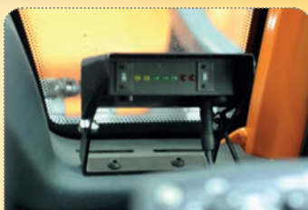
Volitelný snímač průtoku ukazuje naplnění koše.

Optional flow control with fill level indicator