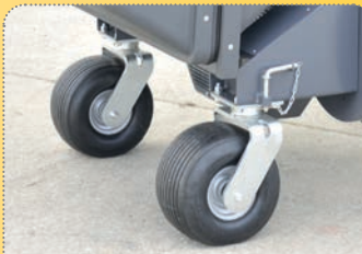
Velká opěrná kola zajišťují stabilitu za jízdy, ale i při otáčení.

All implements offer high dump and low dump with different tractor-specific color adaptations. The high-dump versions are factory-equipped with electro-magnetic changeover valve.